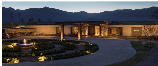
THE VINE RESORT &amp; SPA