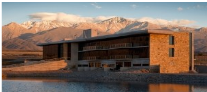
CASA DE UCO VINEYARDS &amp; WINE RESORT