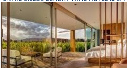
ENTRE CIELOS LUXURY WINE HOTEL &amp; SPA

Seguro incluído para passageiros com menos de 75 anos. Acréscimo para maiores: U$20