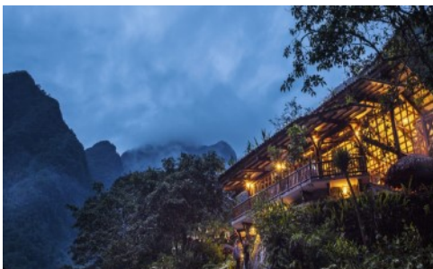
Belmond Sanctuary Lodge