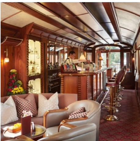
Belmond Miraflores Park