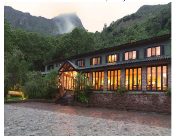
Belmond Sanctuary Lodge

Café da manhã. Na hora estipulada, traslado ao aeroporto para embarque com destino ao Brasil.