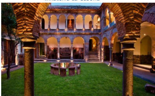
Inkaterra La Casona

Café da manhã. Na hora estipulada, traslado ao aeroporto para embarque com destino ao Brasil.