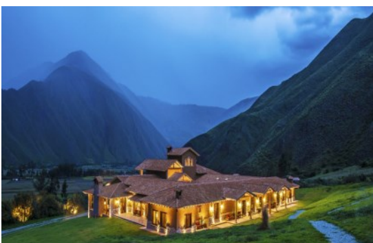
Inkaterra Hacienda Urubamba